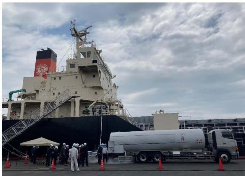
LBM の Truck to Ship バンカリング風景