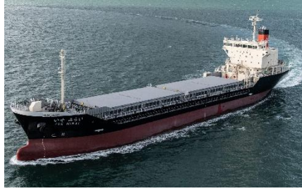
家畜糞尿由来の液化バイオメタン(LBM)を船舶燃料として利用